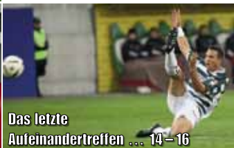
Das letzte Aufeinandertreffen ... 14–16