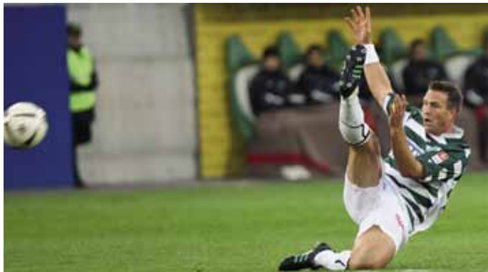
Tabelle klassiert, die Ostschweizer zu Hause noch ohne Verlustpunkt. Und der FCSG wurde seiner Favoritenrolle gerecht: Ohne brillieren zu müssen, fuhren die St.Galler einen ungefährdeten Sieg ein. Nyon versuchte, dem FC St.Gallen mit einer massierten Defensive das Leben schwer zu machen. Der Plan schien vorerst aufzugehen; die St.Galler waren zwar oft im Angriff, blieben jedoch immer wieder in der gegnerischen Verteidigung hängen. So war es wenig überraschend ein Distanzschuss, der erstmals für Gefahr

Der FC St.Gallen stieg als haushoher Favorit ins Heimspiel gegen Stade Nyonnais. Der Aufsteiger war vor diesem 9. Spieltag der Saison 2008/09 im hinteren Teil der