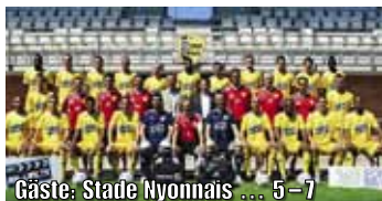
Gäste: Stade Nyonnais ... 5–7