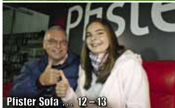
Pfister Sofa ... 12–13